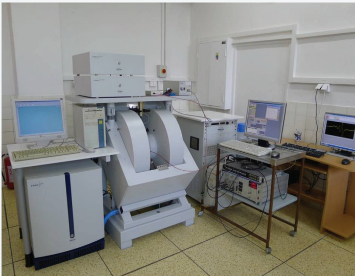
EPR spektrometer EMX-Plus (X- a Q- pásmo)