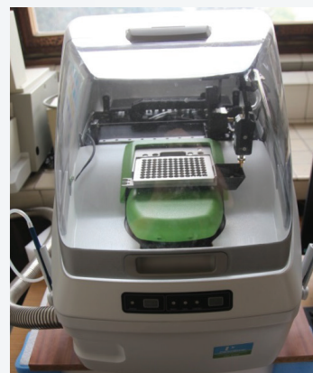
DSC kalorimeter DSC 8500