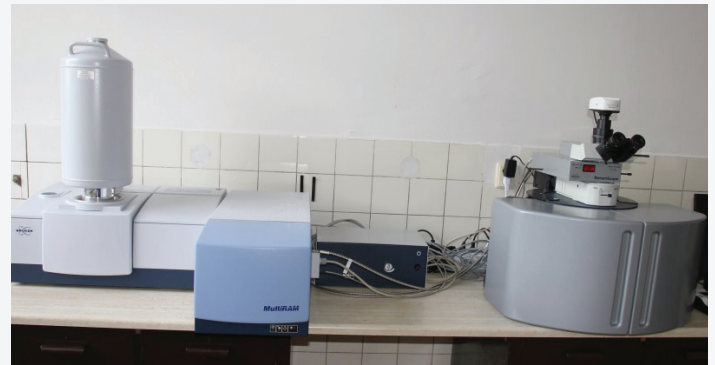
Ramanov spektrometer MultiRAM s mikroskopom RamScope III