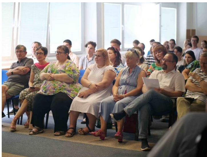
Pozvaní hostia s študenti na slávnostnom ukončení LŠCH.