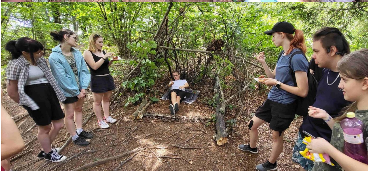
Aktivity počas výletu