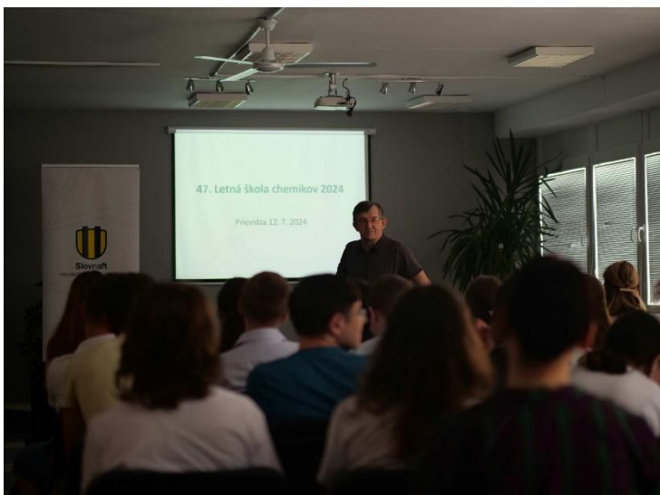
Doc. Reguli počas popularizačnej prednášky.