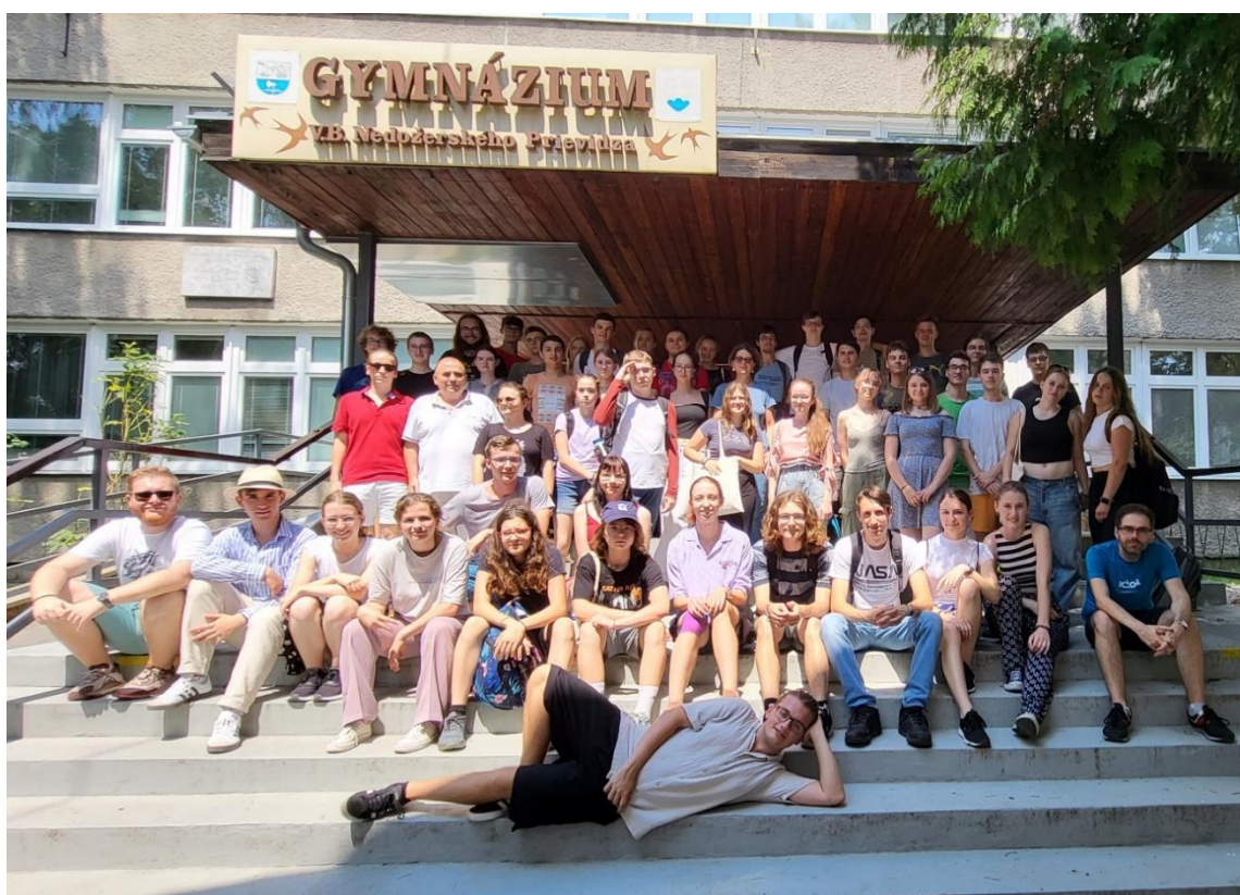
Tohtoroční účastníci 47. ročníka Letnej školy chemikov.

https://chemickaolympiada.sk/aktivity-organizovane-cho/letna-skola-chemikov/