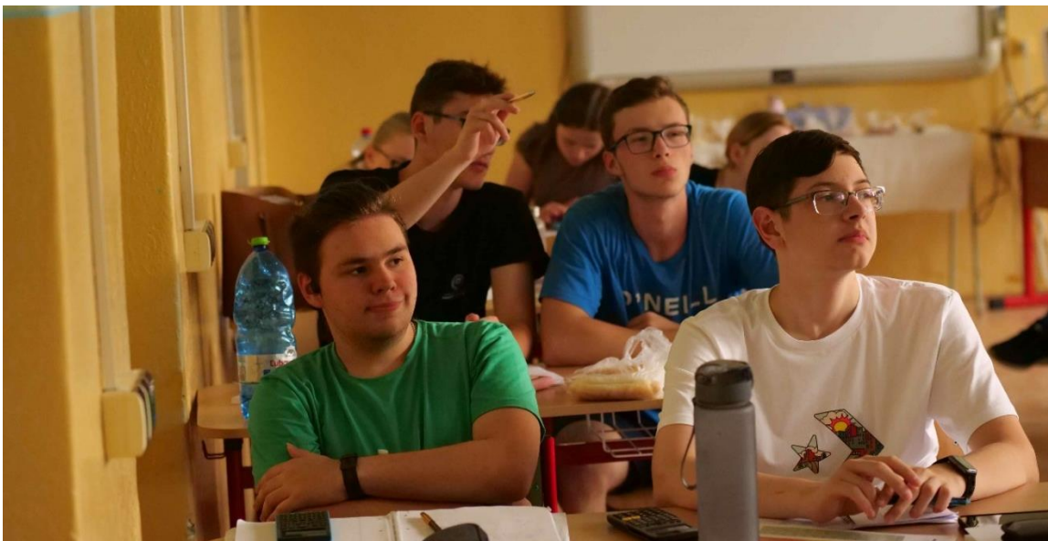
Prednášky v priestoroch Gymnázia V. B. Nedožerského v Prievidzi a SOŠ Nováky.