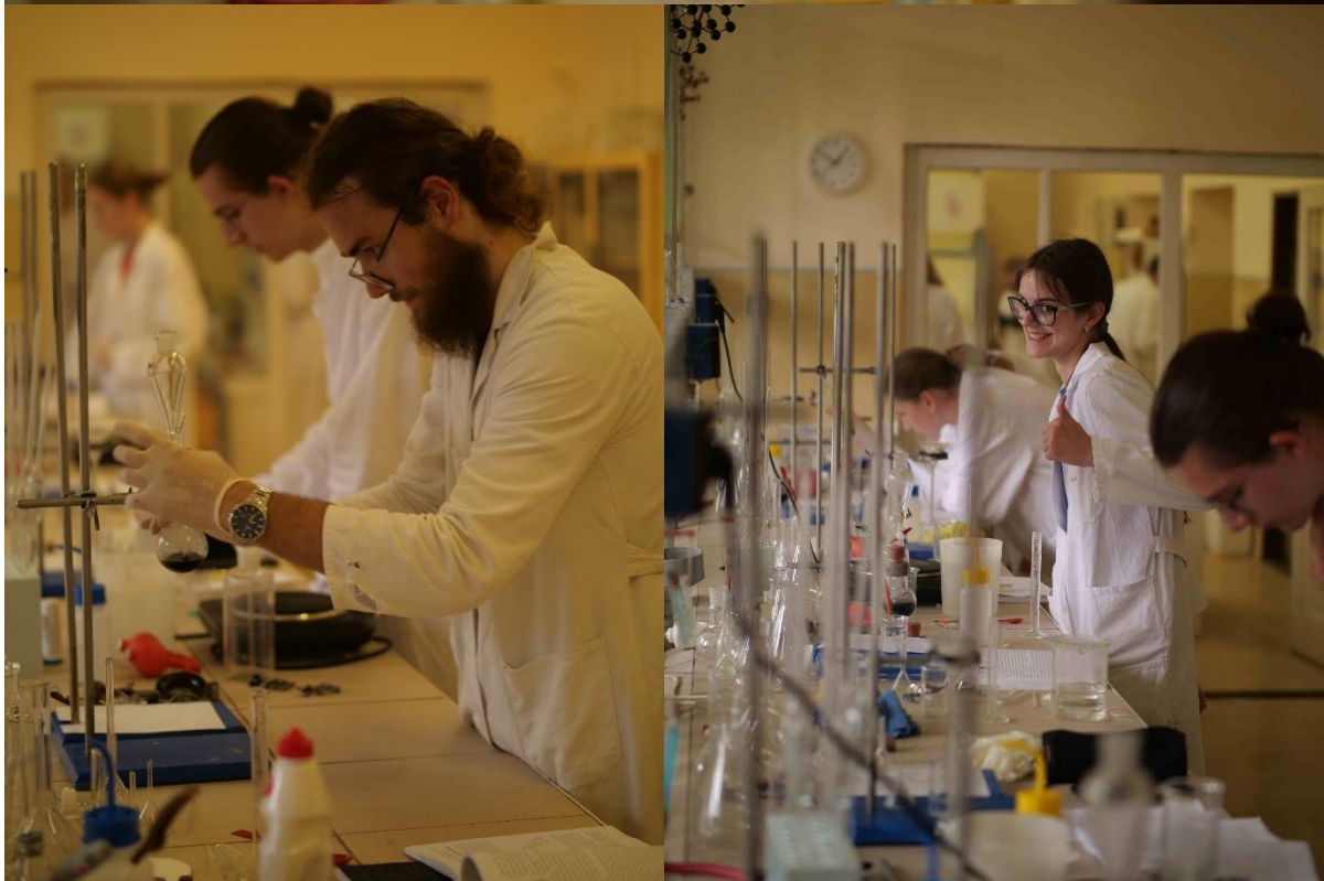
Laboratórne cvičenia z anorganickej, organickej, analytickej chémie a biochémie – SOŠ Nováky.